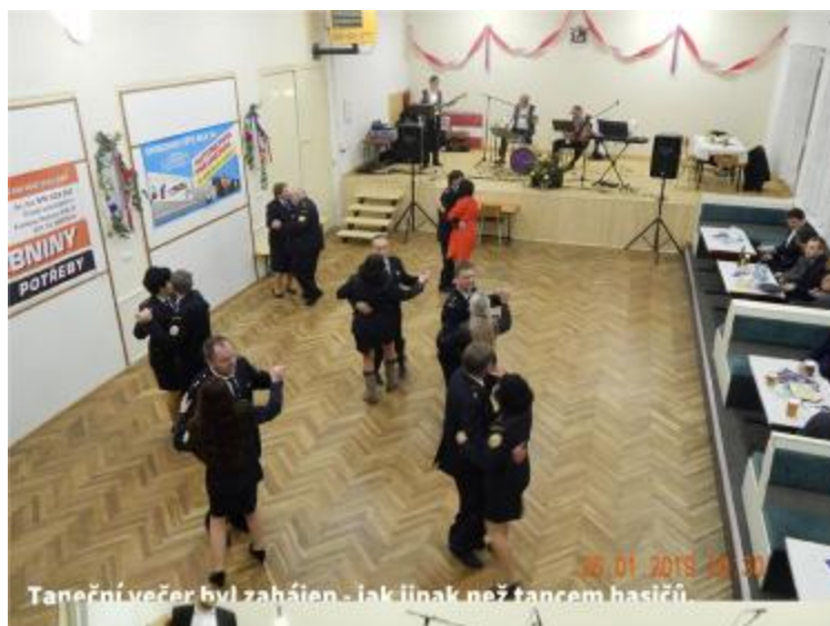
Taneční večer byl zahájen - jak jinak než tancem hasičů.

Je jen ke škodě, že se plesu zúčastnilo více přespolečných hostů než místních spoluobčanů.